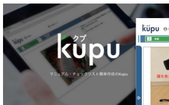
タブレットで簡単操作

製品／サービスの URL : https://www.tairapromote.co.jp/kupu/kupu.html (ハイパーリンクを挿入しておいてください)